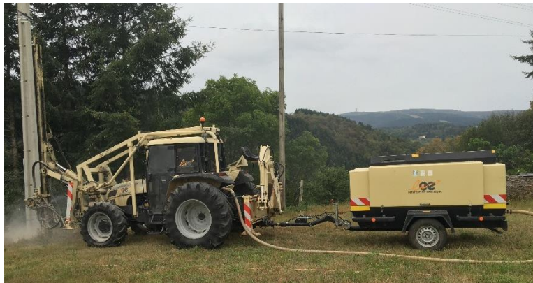
Foreuse sur tracteur