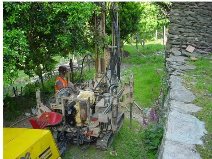
Foreuse sur chenille