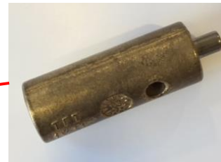
Tête connectrice à frapper