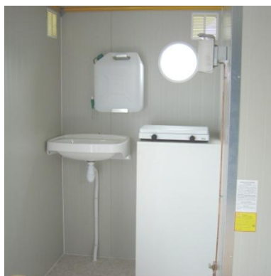
Lavabo et réchaud gaz