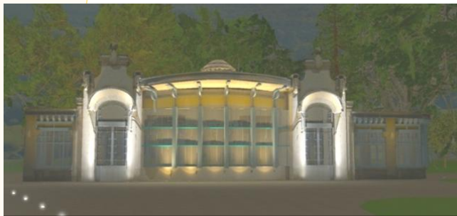
Simulation de l'éclairage du Pavillon des Sources de Saint Léger

Pour réaliser ce projet, il a fallu 50 projecteurs, 700 ml de câble, 4 commandes d'éclairage afin d'aboutir à cette lumineuse réussite.