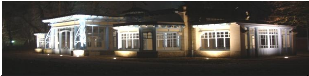
Façade du Pavillon des Sources de Saint Léger après réalisation

Nous remercions l'ensemble de nos collaborateurs pour leurs performances.