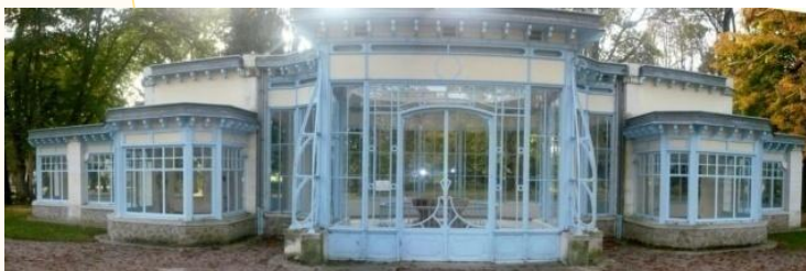
Façade du Pavillon des Sources de Saint Léger

Le Centre d'Art est implanté dans l'ancienne station thermale de Pougues les Eaux.