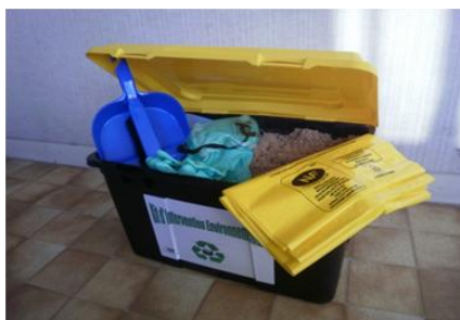
Kit Environnement 40 litres