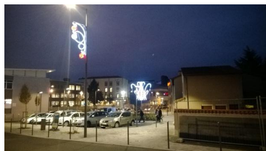
Ville de Chamalières - Avenue Claussat

Ainsi un rideau lumineux de 68 m de long, 10 m de haut, 270 descentes de 10 m (135 guirlandes de 20 m sécables tous les 5 m) a été installé sur le nouvel Opéra de la Ville de Clermont-Ferrand récemment inauguré.