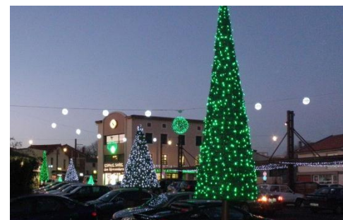
Ville du Cendre - Place Grassion

Vous pouvez retrouver sur une plaquette spécifique « illuminations » toute notre technicité et tout notre savoir-faire sur ce corps de métier ainsi que d'autres belles réalisations.