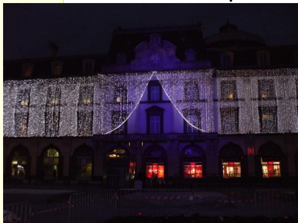
Opéra de la Ville de Clermont-Ferrand

Nous remercions l'ensemble de ce personnel pour leur efficacité et leur capacité d'intégration.